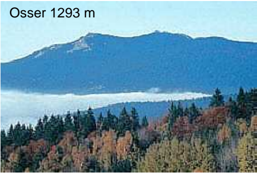
Osser 1293 m