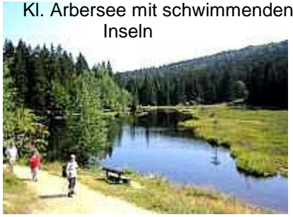
Kl. Arbersee mit schwimmenden Inseln