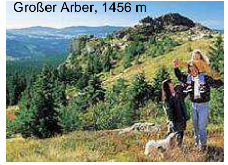
Großer Arber, 1456 m

Aktive Freizeit... Wandern, Schwimmen, Biken, Reiten, Gleitschirm- und Drachenfiegen, alles wird zum Erlebnis. Frische Energie für Körper, Geist und Seele mit Wellness, Klimakur und geführten Terrakur - Wanderungen. Die Lust zum Aktivsein müssen Sie mitbringen. Alles andere und die Vielfalt an Möglichkeiten haben wir.