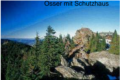
Osser mit Schutzhäusl